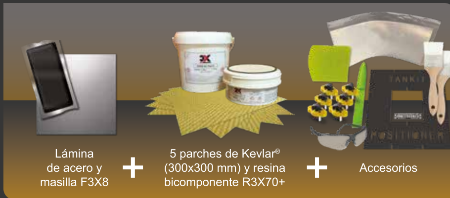
Lámina de acero y masilla F3X8